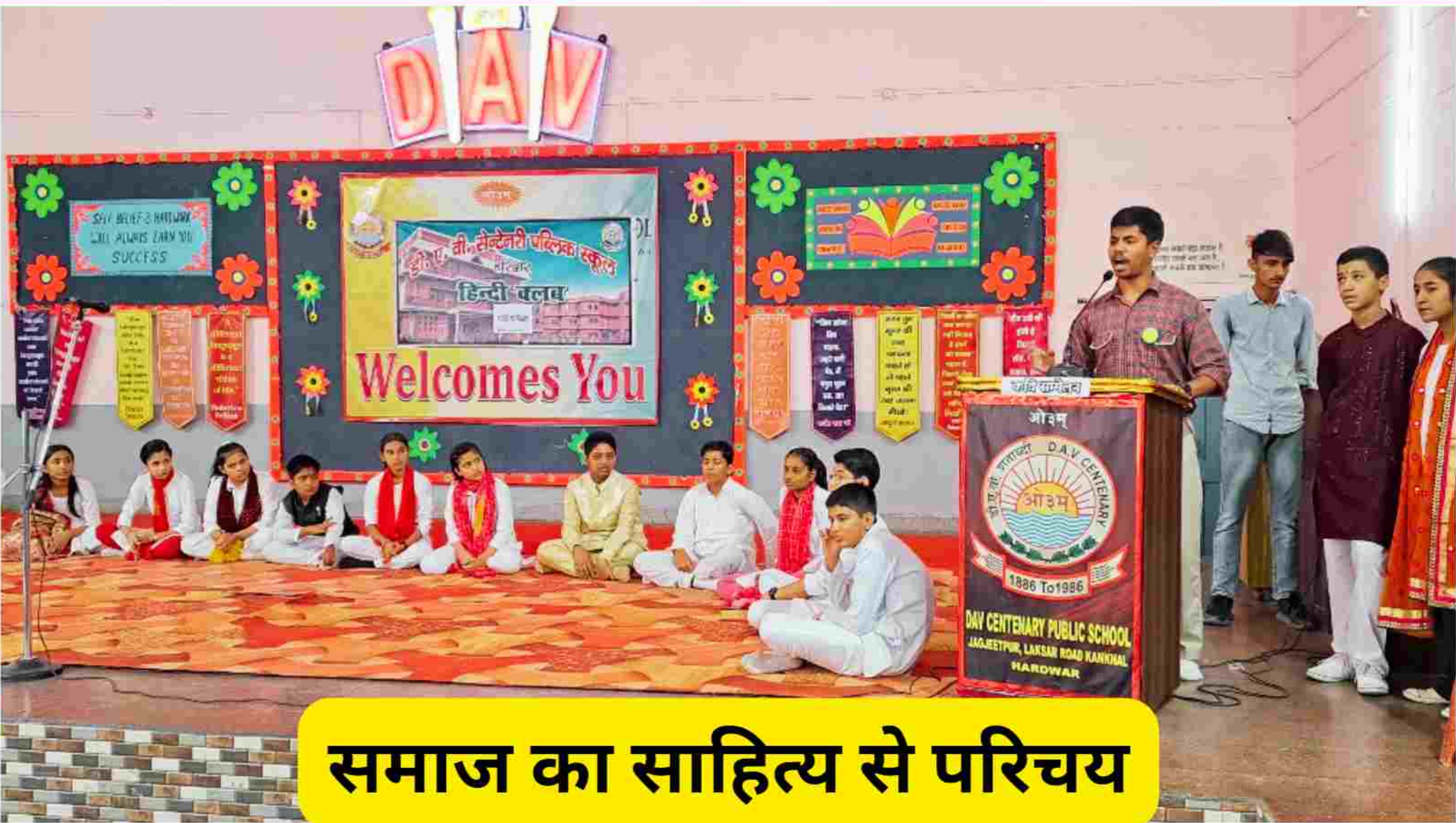
समाज का साहित्य से परिचय